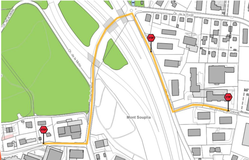
Ligne N° 1 : Champ-Colomb → Croset